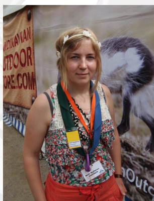
Emmi Lahden Katajaiset

Mulla on unikaverina vaaleanpunainen Angry Bird.